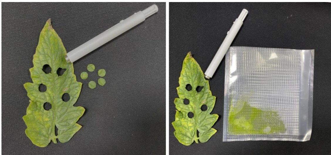
图1 样品的采集与研磨